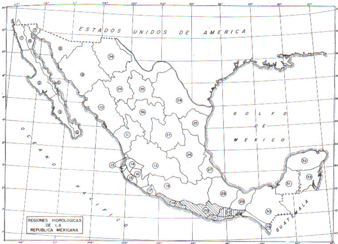
Figura No. 5 Mapa de las regiones hidrológicas de la República Mexicana