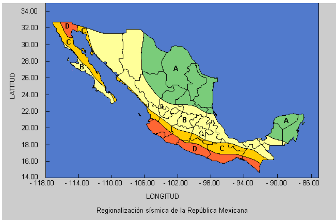
Fig. No. 4

grandes sismos que aparecen en los registros históricos y los registros de aceleración del suelo de algunos de los grandes temblores ocurridos en este siglo. Estas zonas son un reflejo de que tan frecuentes son los sismos en las diversas regiones y la máxima aceleración del suelo a esperar durante un siglo. La zona A es una zona donde no se tienen registros históricos de sismos, no se han reportado sismos en los últimos 80 años y no se esperan aceleraciones del suelo mayores a un 10% de la aceleración de la gravedad a causa de temblores. La zona D es una zona donde se han reportado grandes sismos históricos, donde la ocurrencia de sismos es muy frecuente y las aceleraciones del suelo pueden sobrepasar el 70% de la aceleración de la gravedad. En estos momentos precisamente y debido al sismo de 7.4 grados en la escala de Richter, ocurrido el pasado 20 de marzo del presente año; la región de la Costa Chica se encuentra inmersa en una crisis por los daños severos sufridos por municipios como Ometepec, Cacahuatpec, Santiago Pinotepa Nacional y al menos veinte municipios mas. Las otras dos zonas (B y C) son zonas intermedias, donde se registran sismos no tan frecuentemente o son zonas afectadas por altas aceleraciones pero que no sobrepasan el 70% de la aceleración del suelo.