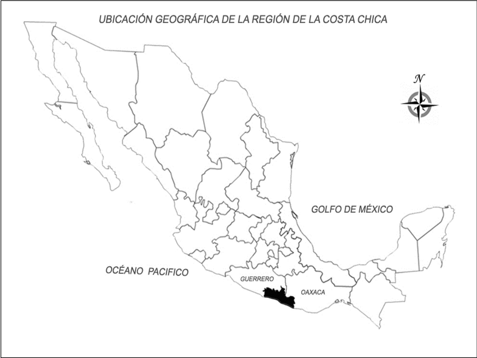
Fig. No. 1