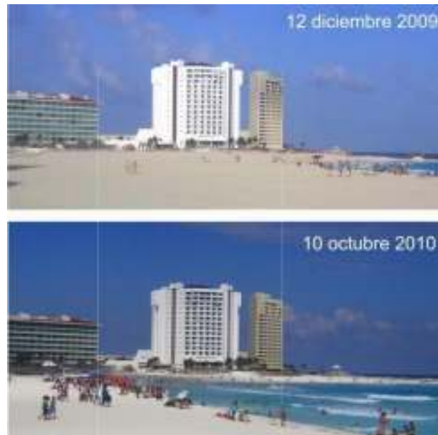
Figura 4 Pérdida de playa en Cancún, Quintana Roo

La pérdida de playas ha llevado a tomar medidas, en algunos casos de emergencia, para reparar los daños, recuperar playas y prevenir la erosión, tales como la alimentación artificial de playas. Los costos de inversión de estas acciones son cuantiosos si se considera que requieren mantenimiento periódico. Además, la capacidad de recuperación de las playas después de los huracanes y el oleaje swell persistente en forma oblicua sobre las mismas son factores determinantes para la durabilidad de los proyectos de alimentación artificial de playas. Otro problema presente es que en playas como las de Playa del Carmen, los usuarios han colocado obras de protección en forma indiscriminada, las cuales han sido diseñadas de manera inadecuada, complicando a situación.