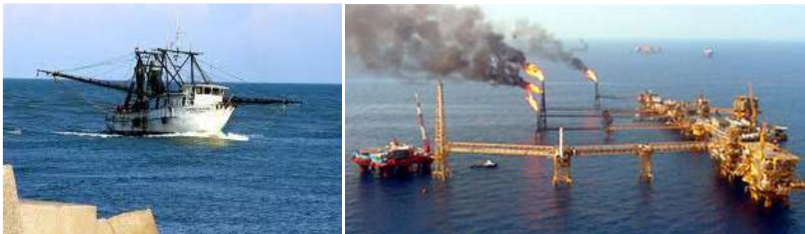
Figura 1 Barco pesquero, Oaxaca (derecha) y plataforma petrolera AKAL B en Campeche (izquierda)

Por otra parte, los recursos petroleros localizados en la plataforma continental han sido explotados intensamente desde hace décadas, lo cual ha resultado benéfico para el país desde el punto de vista económico, sin embargo, ha generado impactos ambientales negativos a los ecosistemas marinos. Además de estas actividades, las costas mexicanas representan fuentes de generación de recursos económicos para México gracias al interés turístico y recreativo que existe en sus playas, tanto a nivel nacional como internacional.