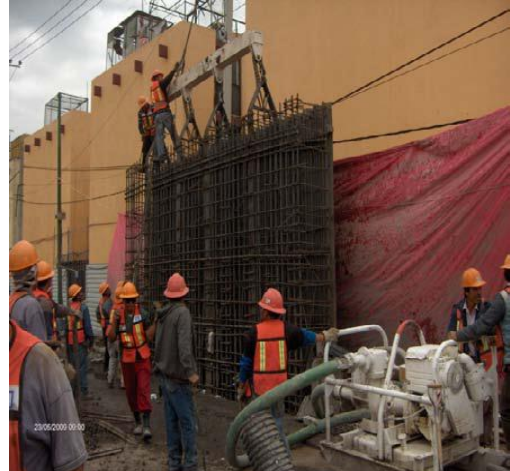
b) Armado e izaje del Muro Milán