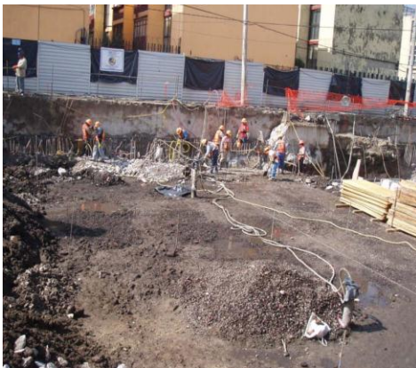
a) Preparación del terreno