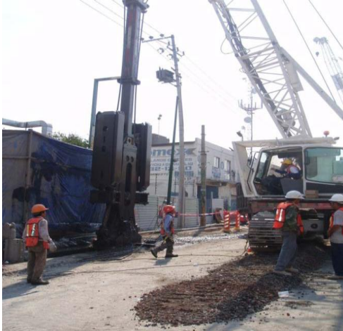
a) Excavación de zanja para Muro Milán