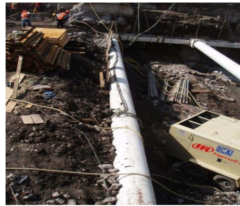
b) Colocación de troqueles