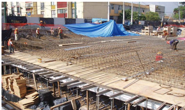
Figura 3.5. Preparación y colado de la losa tapa